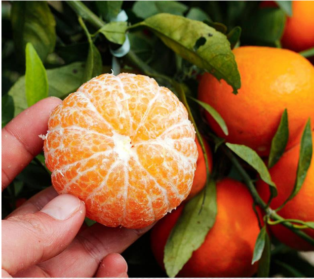
学生拍摄的沃柑作品