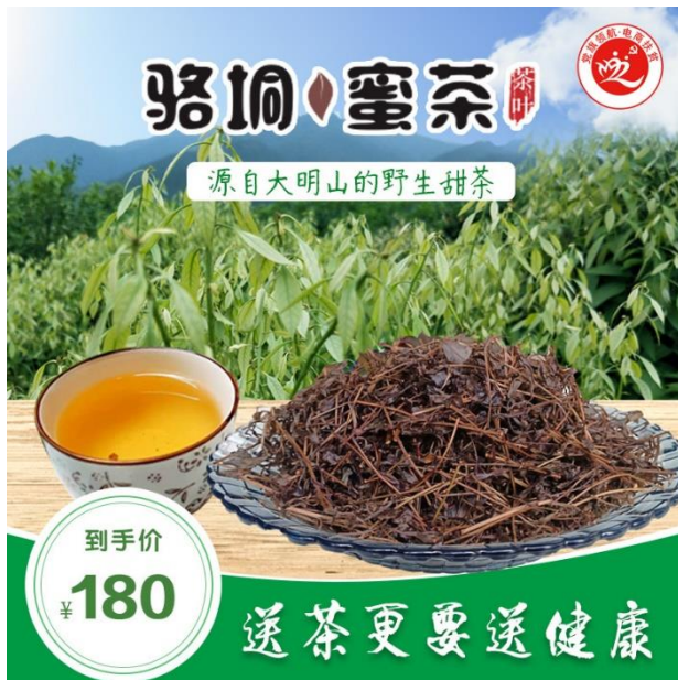
学生制作的主图作品