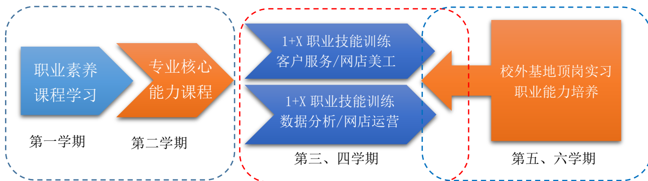
图一 电子商务专业“1+X”复合型人才培养模式

和区域经济发展人才需求，我校成立了由行业企业专家参与的专业建设指导委员会，召开专业建设指导委员会会议，在委员会的指导下，在充分调研论证的基础上，确立以行业需求为导向，以职业能力为本位，以职业岗位群工作过程为依据，深化校企合作、产教融合，推进三教改革，制定了制定具有针对性又兼具行业发展需求的人才培养方案，形成了基于课证融通的“1+X”复合型人才培养模式（如图一示），满足了学生的职业发展需求。