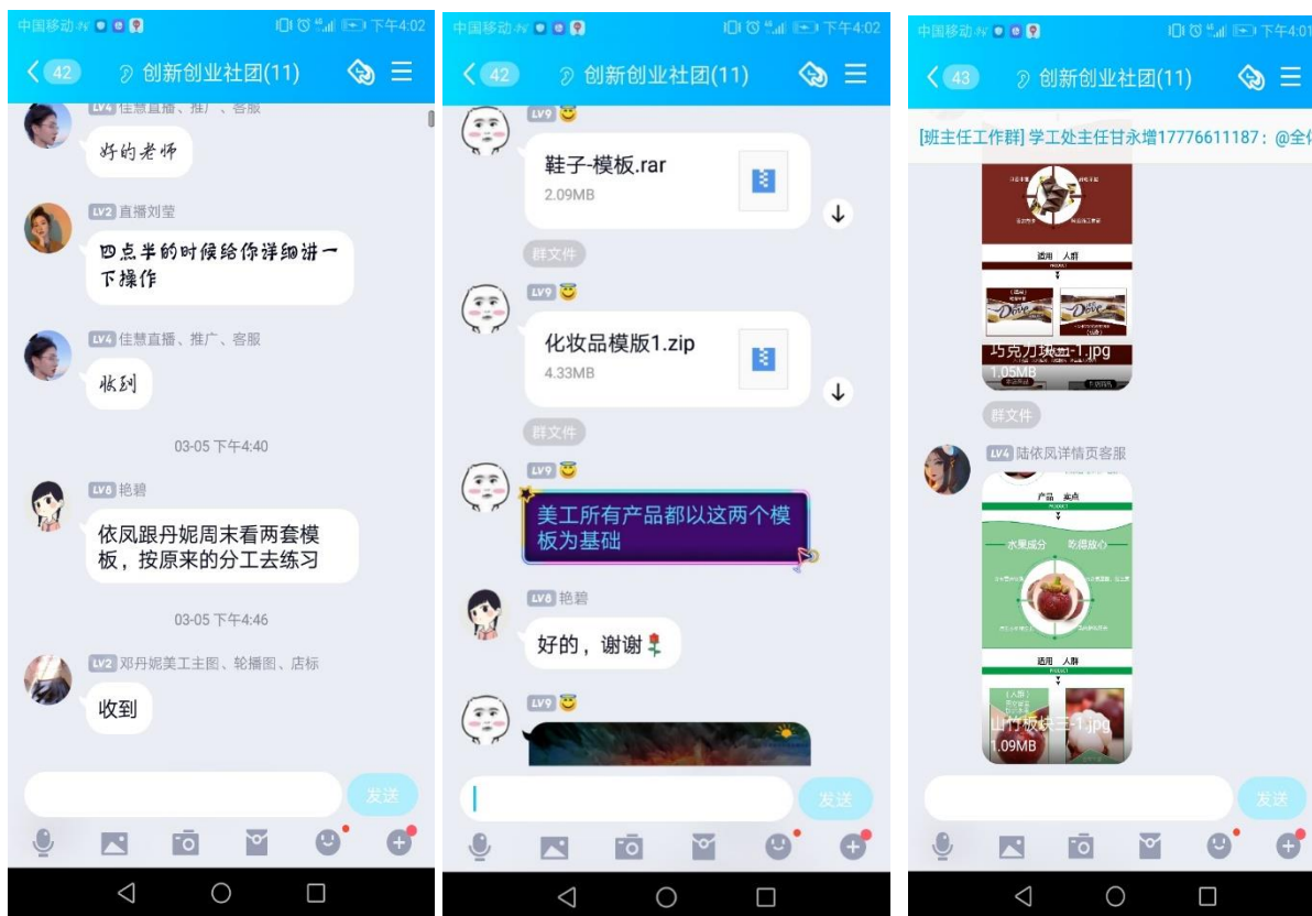
创新创业社团 QQ 群沟通记录

为进一步提升团队荣誉感和向心力，实现零距离教学，该项目利用师生与互联网和移动设备的粘合度，搭建扁平化的线上全员沟通平台；前期成立导师授课讨论群、创客空间社团 QQ 群，将专业教师、企业专家以及学员三者组织起来，搭建三者之间的桥梁，拉近他们之间的距离，加快信息流速率，实现不受时间、地点限制的扁平化、高效化沟通。信息公开、透明，适合大家了解项目现状。