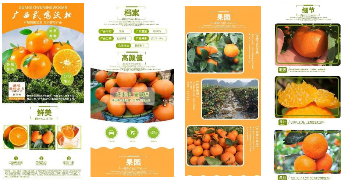
学生制作的广西武鸣沃柑描述部分截图作品